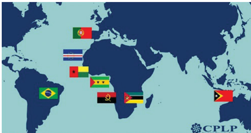
Ilustração 1 - Mapa com a distribuição geográfica dos nove países da CPLP

Mas se a CPLP surgiu no início para manter interesses portugueses sob as suas ex-colônias, ela também pode ser vista como uma ponte institucional para que os países mais pobres dessa comunidade possam ter acesso às promessas de uma globalização, principalmente a partir da ex-metrópole. Tendo ou não a proeminência de Portugal, o importante é que a ideia da CPLP como uma comunidade de fato circunscreve povos diferentes, mas que possuem fios histórico-identitários constitutivos deles mesmos e entrelaçados entre si. Assim, parece impossível pensar na constituição das nações e dos povos da CPLP sem considerar todos os seus atores em suas unidades e diversidades.