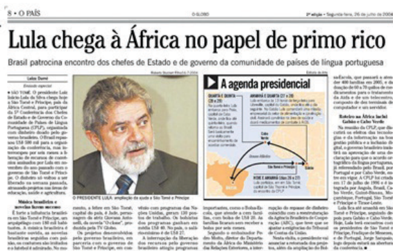
Figura 2 – Recorte de parte da notícia em O Globo ( O País , 26/07/2004, p. 8)

Em 13/04/1999, a Folha (Brasil, p. 6) trata da ida do presidente FHC a Lisboa. Diz o jornal: “A visita a Portugal seria mais de compadrio, dado o relacionamento histórico entre os dois países”. Contextualiza a Folha : “A CPLP, que reúne, além de Brasil e Portugal, as antigas colônias africanas de Portugal”. Ora, apenas os países africanos foram colônias? O jornal esquece que o Brasil também foi colônia e lembra do “compadrio” e do “relacionamento histórico” com Portugal.