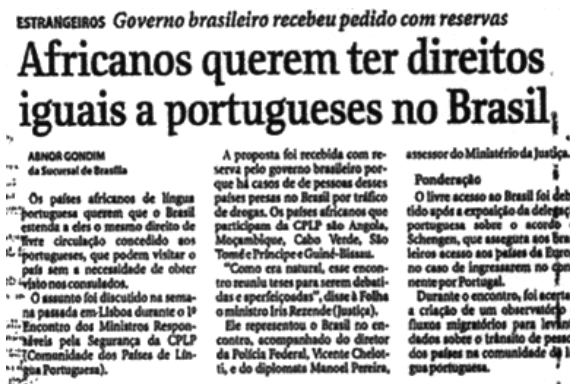
Figura 3 – Recorte de parte da notícia na Folha de S. Paulo (Cotidiano, 15/07/1997, p. 4)

Os rastros das notícias nesses dois jornais revelam no Brasil a existência de uma relação diplomática fria, distante e protocolar, que atende as demandas pleiteadas pelos próprios países africanos. Dois aspectos chamam atenção a partir dos poucos registros: uma postura de indícios neoimperiais da política brasileira junto à África portuguesa e a insistente relação de troca dos apoios/acordos econômicos e sociais por votos no Brasil para uma cadeira permanente no Conselho de Segurança da ONU. Esta última é uma ancoragem que está presente em 89,2% de todos os registros sobre a CPLP nos dois jornais. As profundas relações histórico-identitárias entre os países dessa comunidade quase não foram levadas em conta nos pequenos registros nos dois jornais, emergindo como raros rastros em apenas 8% de total de notícias.