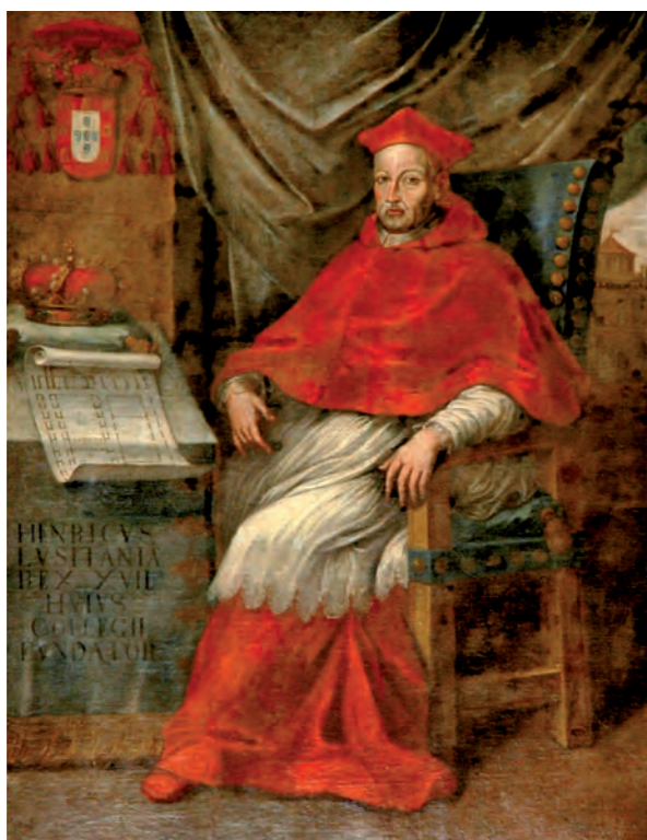
Fig. 2|| Cardeal D. Henrique apresentado como fundador da Universidade de Évora 36