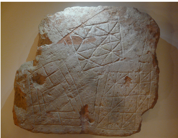
Fig. 4 - Foto del fragmento del ladrillo conservado.

como parte de un suelo -ya que sólo está grabado en una de sus caras y su peso forzaría su uso fijo-, también hubo en la antigüedad tableros portátiles.