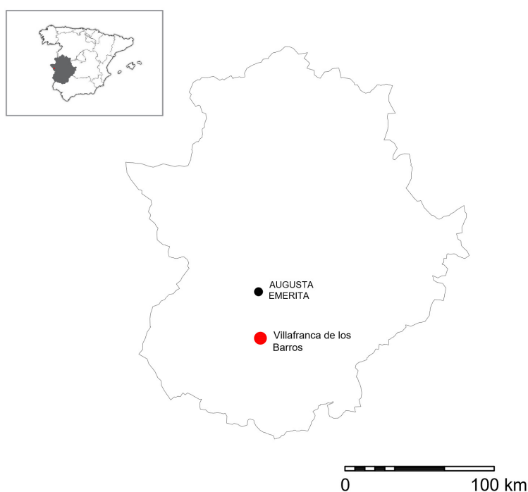
Fig. 1 - Mapa con ubicación del término municipal de Villafranca de los Barros, Badajoz.

Como ya se ha apuntado previamente y puede observarse en las figuras 3 y 4, nos encontramos ante un ladrillo cuadrangular realizado en cerámica. Presenta una pasta de