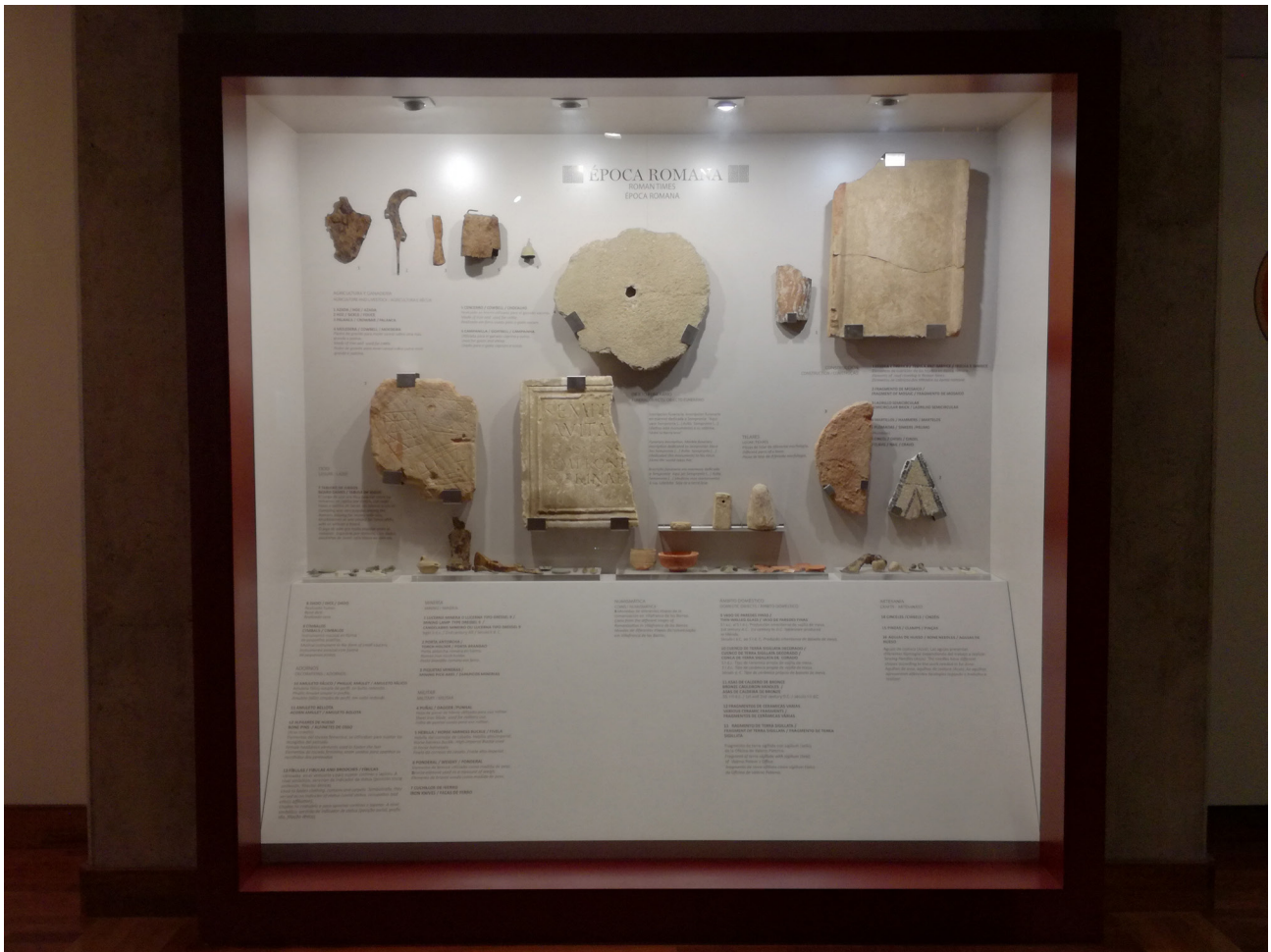
Fig. 2 - Ubicación de la pieza en el Museo de Villafranca de los Barros.

coloración naranja intenso y, macroscópicamente, se pueden aislar desgrasantes de granulometría media-alta. La parte superior, donde se ubican los tableros, presenta un leve alisado. La cara inferior, por el contrario, exterioriza una apariencia rugosa fruto, posiblemente, de su ubicación sobre una superficie irregular durante su manufactura. Por los restos que se atisban, inicialmente, pudo tener una leve aguada blanquecina que la recubriría en su integridad. A día de hoy no es posible establecer un posible foco de producción, sin embargo, no hay que olvidar que la producción cerámica en el entorno está atestiguada desde época antigua (Bustamante Álvarez, Galves Pérez y García Cabezas, 2013) y, prácticamente, se ha mantenido hasta la actualidad no sólo por los restos que aún