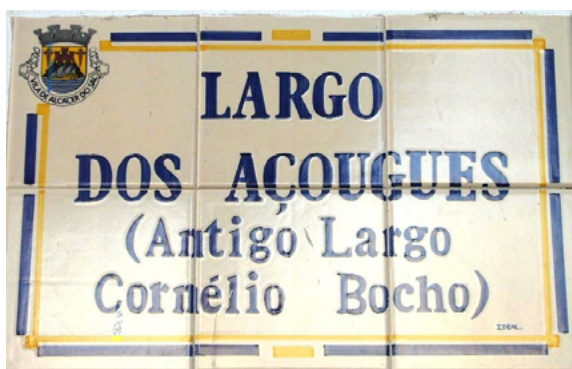
Figura 2. Placa toponímica de Alcácer do Sal.

quia acedeu a honrá-lo mediante a atribuição do seu nome a um dos largos da cidade. Uma forma, pensava-se, de mostrar a antiguidade do sítio e o prestígio maior que um dos seus ilustres antepassados lograra obter. «Mãe, e quem foi esse Cornélio Bocho?». A mãe dificilmente o poderia explicar, até porque o nome não se enquadrava lá muito bem na antroponímia usual e, por outro lado, como é que deveria pronunciar-se: Bocho ou Boco ? Para manter a tradição, o melhor foi, por conseguinte, voltar atrás e recordar algo de mais concreto, mais condizente com as necessidades quotidianas: o matadouro!