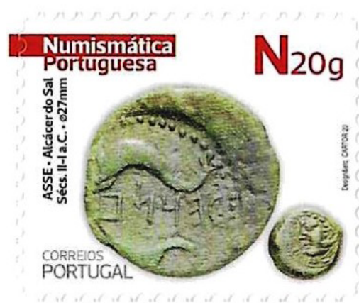
Figura 1. Selo dos CTT com a imagem de uma moeda de Salacia.

mia e a cultura. Três domínios obviamente nunca indissociáveis – e esta é também uma das consciencializações que as movimentações dos nossos dias nos ajudaram a ter presente: política, economia e cultura andam a par, têm de andar a par.