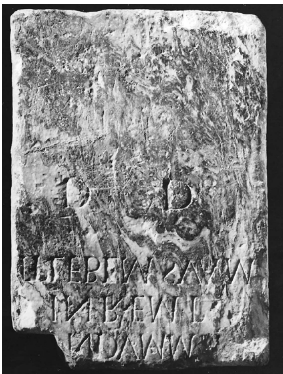
Figura 4. Pedestal em honra de Iunius Philon (face 2).

Poderá, desde logo, salientar-se – e este será, porventura, um aspecto nem sempre devidamente tido em conta – o exemplar funcionamento, por quanto nos é dado entender, do poder local.