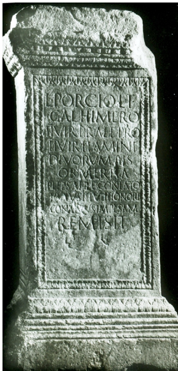
Figura 5. Pedestal em honra de L. Porcius Himerus.

2º) O segundo documento epigráfico refere-se a outro duúnviro, Lúcio Pórcio Hímero, também ele de cognome grego, assinala-se! (IRCP 187 – Figura 5). Foi, a dado momento, escolhido para exercer, em regime de substituição, funções duunvirais e duas vezes o elegeram flâmine dos imperadores divinizados. Também neste caso a plebe reconheceu os seus méritos, organizou subscrição para pagar