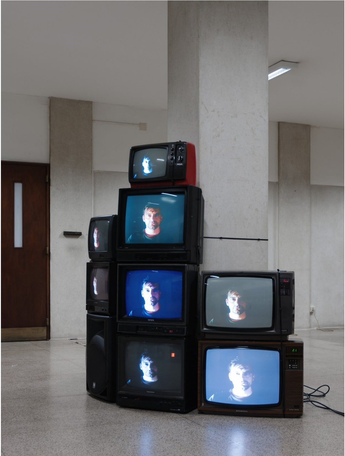
Suspension of Disbelief . Vídeo-instalação. 2013.