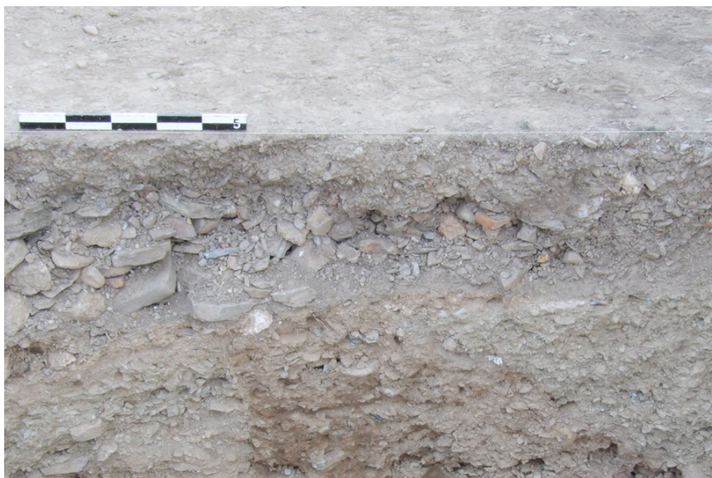
Fig. 2. Linhas interfaciais verticais das paredes em taipa visíveis num dos cortes estratigráficos da primeira sondagem efectuada.

sucinta remete-nos agora para o seguinte: o desconhecimento – para determinados contextos – de certas realidades arqueológicas poderão ditar o seu continuado não registo. A probabilidade disto acontecer aumenta quando essa realidade assume particulares características que concorrem para a sua “invisibilidade”. E repetir-se-á