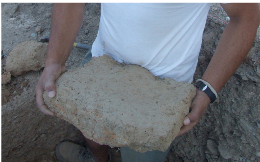
Fig. 9. Adobe recolhido num derrube

associado a ambientes sociais indígenas (Carvalho, 2009, pp. 118-119). Mas este facto não constitui, só por si, prova desse “indigenismo”, quer porque se desconhece quase por completo os tipos de construção utilizadas nesta região no final da Idade do Ferro, quer por que estas paredes já surgem em claros níveis de ocupação romana, associadas a outros elementos exógenos, denunciando assim a presença de ambientes sociais claramente integrados no modo de vida romano. Seja como for, a técnica específica que se documenta em Idanha-a-Velha nunca poderá ter surgido nestes territórios antes da construção de casas rectangulares, podendo, assim sendo, apresentar mais afinidades com o “saber fazer” romano. Mas, porventura, talvez também não se justifique colocar esta questão, por agora, até porque a construção em terra, por todas as mais-valias que encerrava, terá sido comum a estes dois “mundos”.