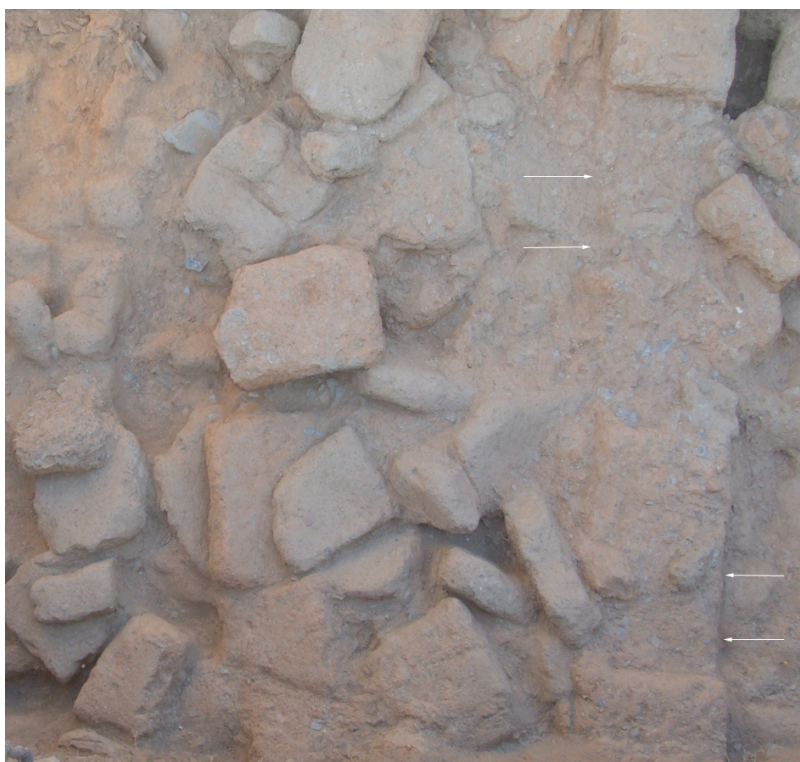
Fig. 6. Parede em adobe e respectivo derrube