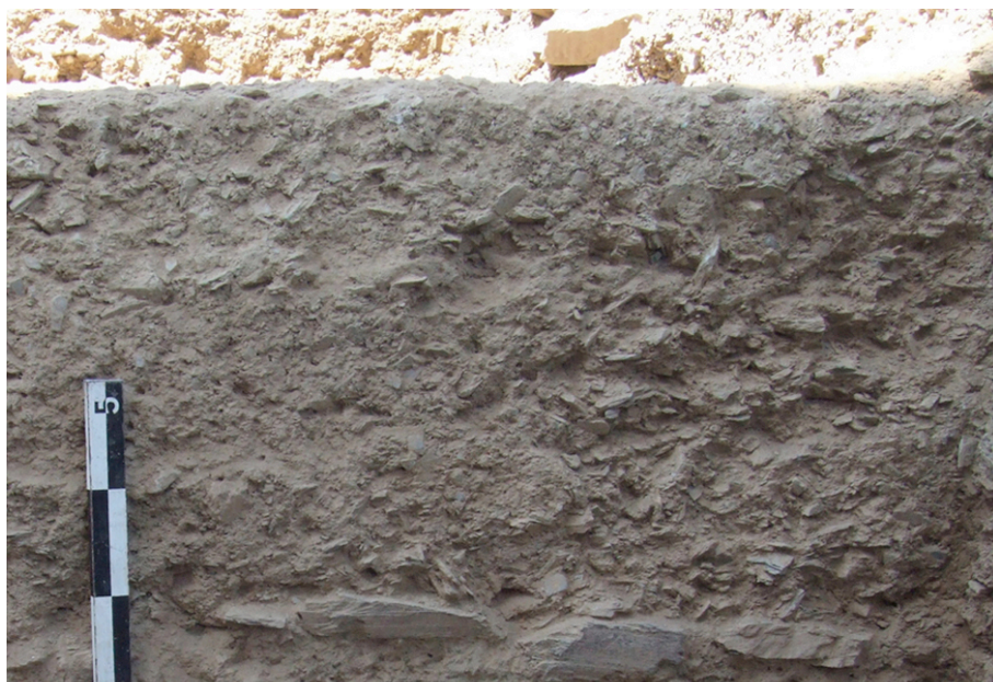
Fig. 7. Fiada de estreitas lajes de xisto a marcar a linha de contacto da parede em taipa com o chão térreo

construção romana raramente (ou mesmo nunca?) atestada na escavação deste tipo de contextos nesta parte setentrional da Lusitania - embora se encontre perfeitamente registada noutras paragens da Hispânia, como por exemplo em Celsa ou Bilbilis, no vale do Ebro, cidades romanas onde o adobe se encontra documentado nas paredes de algumas casas da sua fase inicial (Beltran Lloris e Martin Bueno, 1982, p.149).