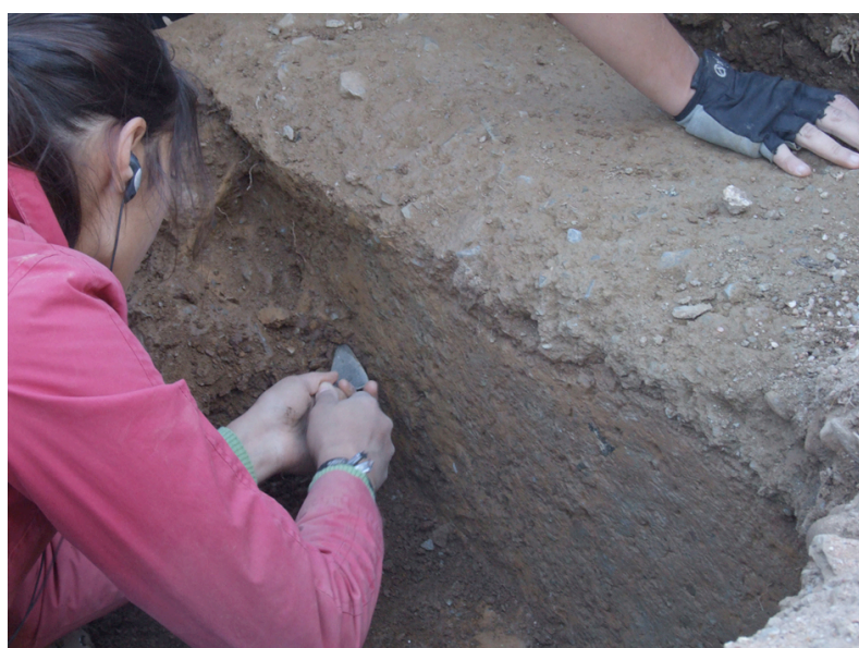
Fig. 3. Processo de identificação de uma parede em taipa

insistentemente sempre que se verifique uma observação menos atenta ou mais apressada; no fundo, sempre que certos procedimentos metodológicos não forem adoptados; ou então – e tal pode ser mais recorrente em certos âmbitos de actuação – sempre que o ritmo de escavação não for o mais adequado.