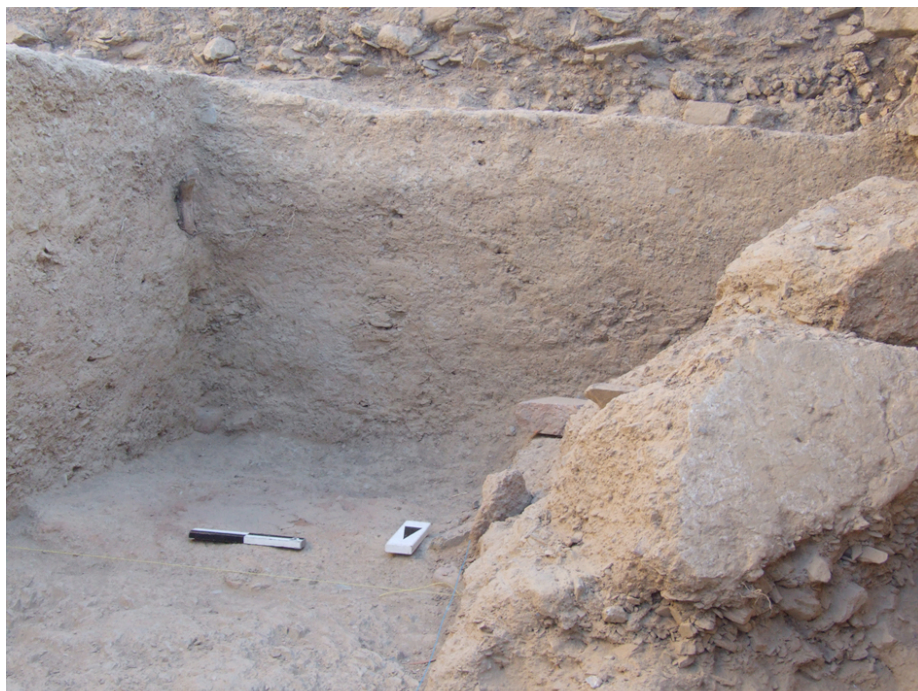
Fig. 4. Troços derrubados das paredes em taipa (depois de terem sido removidos os derrubes desfeitos e paredes em taipa, ao fundo

histórica, i.e., acabará por resultar de um cenário histórico que não (ou raramente) contemplava essas construções; ou então, pelo contrário, se essa quase ausência é apenas aparente, resultante em grande parte de uma abordagem metodológica em escavação que, neste sentido, concorre para distorcer (involuntariamente) os factos que compõem esse mesmo cenário histórico. Sejamos uma vez mais claros: uma escavação, e os dados que colhe e proporciona, não encerrará toda a realidade objectiva que se encontrava depositada no lugar intervencionado. Desde logo, qualquer escavação, e a gama de resultados que produz, acaba sempre por ser em parte resultado do seu tempo – do tipo de abordagem efectuada, do enfoque teórico que a norteou e, sobretudo, da metodologia empregue.