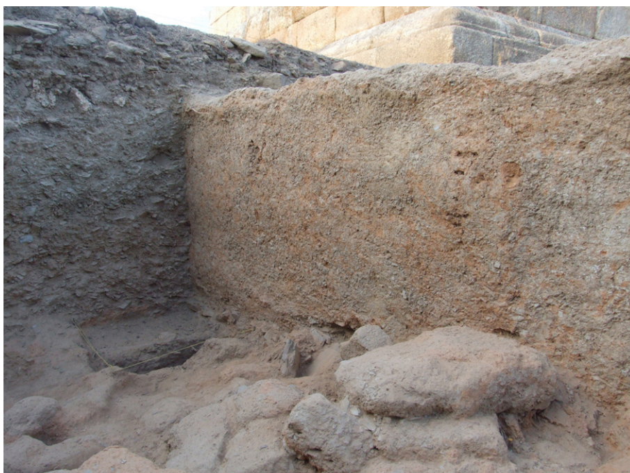
Fig. 5. Parede em taipa e templo romano ao fundo.