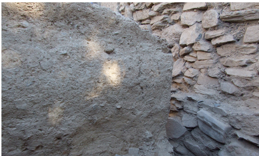
Fig. 8. Paredes em taipa cortada por um dos pórticos do fórum.

Resta saber, porém, entre outras questões em aberto, se esta taipa e