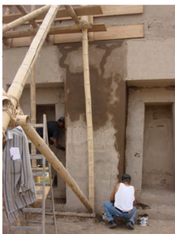
Fig. 4. Aplicaciones de reparación de fisuras por inyección de barro líquido en el Acllawasi. Soluciones amigables.