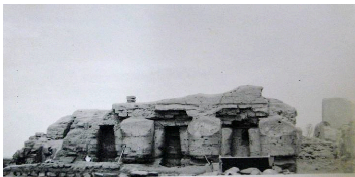
Fig. 1. Pachacamac, Perú. Templo de la Luna. Vista de detalle de tres nichos. 1941.

El problema de la mayor ocurrencia de daños en las construcciones monumentales de tierra se agudiza por la perversa