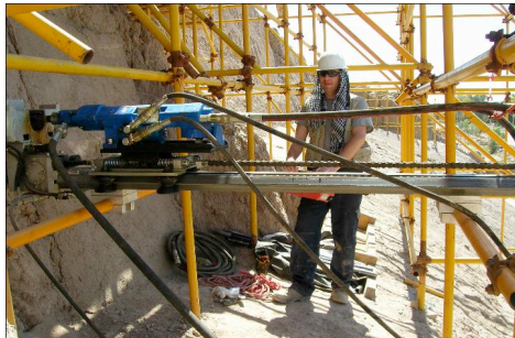
Fig. 6. Andamiaje, perforación y colocación de varillas de fibra de vidrio en posición. Ciudadela de Bam, Irán (Crédito: Ing. Valter Santoro, 2008).

ingeniería sismorresistente de los últimos 50 años demuestran muy claramente la imposibilidad de tratar la conservación patrimonial bajo un mismo conjunto de recomendaciones genéricas.