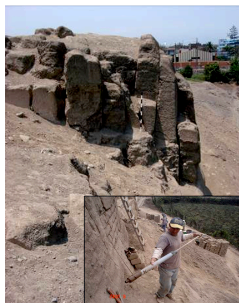
Fig. 3. Muro de sostenimiento debilitado, que se inyecta para multiplicar su resistencia frente a los empujes laterales del relleno.

En la Fig. 3 se observa uno de los múltiples casos de muros de sostenimiento de tapial, formados por capas verticales, que al despegarse entre sí por el paso del tiempo, pierden su continuidad y reducen varias veces su resistencia. Como es sabido, tres capas juntas pero sin adhesión crean un muro de sostenimiento de mucha menor resistencia que la de un muro sólido. La inyección de las juntas entre capas, multiplica su resistencia, sin uso de