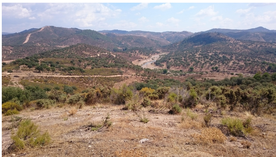
Fig. 2 - Vistas del Río Odiel desde el dolmen de la Peña del Hombre.

En este sentido, aparecen diversos horizontes culturales, como es el caso del grupo de los dólmenes de Aroche, asociados al Río Chanza, que contribuye al Río Guadiana y que corrobora esta teoría de conexión entre culturas y ríos, pues la cultura material y la tipología constructiva de los sepulcros, de cámara y corredor, queda relacionada con los antas de Portugal, que tiene al Chanza y al Guadiana como elementos de conexión cultural (Piñón Varela, 1988). Por su parte, en el Andévalo occidental son frecuentes las construcciones de sepulcros de falsa cúpula o tholos, destacando la necrópolis de la Zarcita (Santa Bárbara de Casa). Otras particularidades se dan en los ejemplos megalíticos de la Campiña onubense, donde sobresale el dolmen de galería de El Soto (Trigueros).