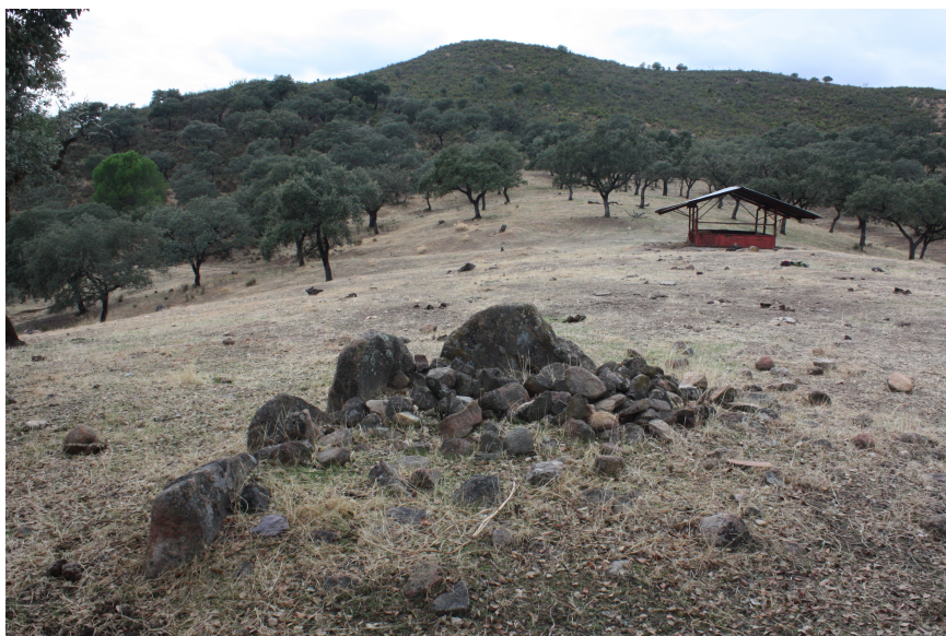
Fig. 4 - Imagen del dolmen.

Los ortostatos O3 y O4 presentan una sinuosa inclinación al exterior, evidenciando que su posición original ha variado con el paso del tiempo, probablemente por la incidencia de las raíces de un árbol que pudo nacer entre ambos. La línea que marcan los ortostatos O2, O3 y O4 parece indicar la dirección de la galería, orientación que quedaría ratificada con la función de cierre del fondo del sepulcro representada por O1. De esta forma la orientación de la galería sería Este-Oeste (Fig. 4).