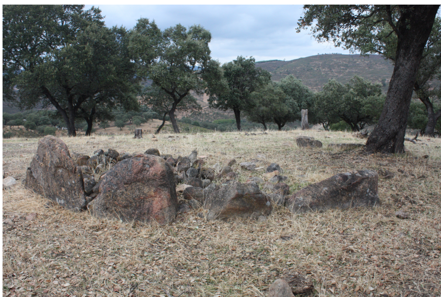
Fig. 3 - Imagen ortostatos.

En atención a este parámetro, podemos citar varios ejemplos de dólmenes, destacando los conjuntos ubicados entre los cursos de los ríos Tinto y Odiel, donde se ubican algunos de los principales grupos de dólmenes del Suroeste peninsular (Cabrero García, 1985). Nos referimos a los conjuntos de dólmenes de El Pozuelo (Zalamea la Real) (Cerdán, Leisner y Leisner, 1952), Los Grabeles (Valderde del Camino), El Villar (Zalamea la Real), El Gallego-Hornueco (Berrocal-El Madroño) o Mesa de las Huecas (Niebla). Todos dólmenes de galería con diversos subtipos. Si bien, existen algunos dólmenes