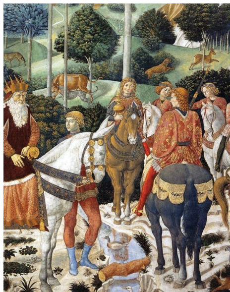
Fig. 7. Benozzo Gozzoli: La procesión de los magos (1459-1461)

animales se muestran de frente al espectador, exactamente de la misma manera en la que Pausias tuvo que disponer sus figuras para lograr el deseado efecto de profundidad. En el Renacimiento se volvió a tener un interés importante en el tema del sacrificio en Roma y de su contexto cultural y político 50 . Se recuperaron las grandes escenas de sacrificio en relieves, arcos o monedas. De esta manera se emparejaban los conceptos de victoria y sacrificio.