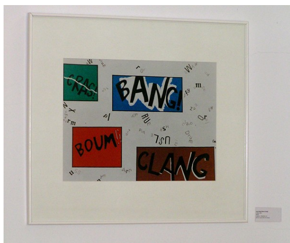
Figura 12. «Cras! Bang! Boum! Clang!», poema-mural projetado em 1988 (imagem; tinta guache sobre papel) e pintado na parede externa do edifício de uma escola em 1995 (400 x 600 cm).