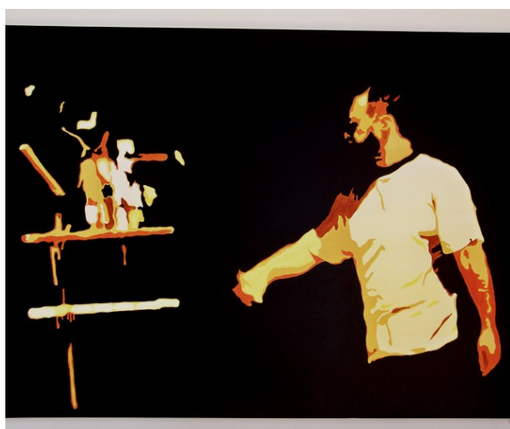
Figura 6. «Tokyo» (2003/2004, 130 x 195 cm).