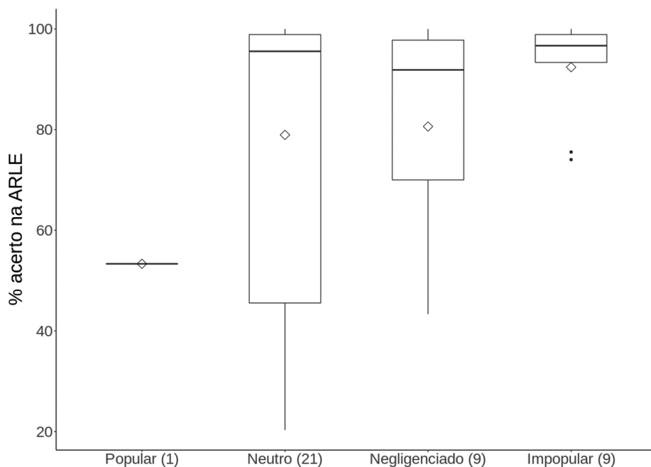
Figura 1. BoxPlot dos z-scores do indicador de desempenho acadêmico em relação ao status sociométrico do grupo de alunos indicados pelos professores.

Observou-se que vários estudantes do Subgrupo Indicado apresentaram resultados superiores a 90% na ARLE. Isso indica que estudantes alfabetizados foram selecionados pelos professores como alunos de baixo desempenho em leitura e escrita.