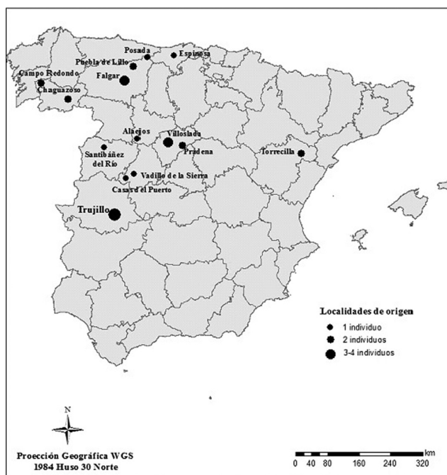
Mapa 2 – Procedencia peninsular de las migraciones a la ciudad de Trujillo