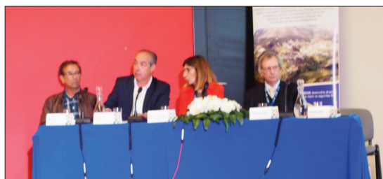
Fot. 1 - Aspeto da mesa da sessão de abertura, durante a intervenção do CODIS de Faro.