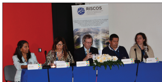
Fot. 8 - Vista da mesa da sessão de encerramento.