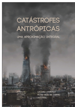
Fig. 3 - Detalhe da capa da obra Catástrofes Antrópicas .